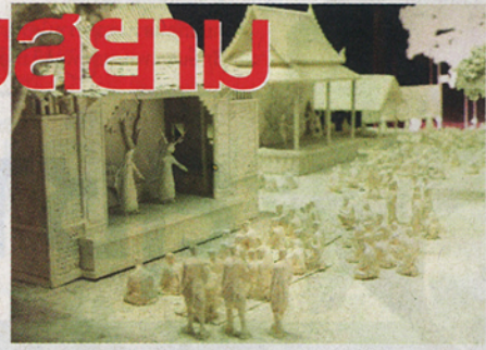
การแสดง มหรสพ

เสวยปลาเช่นกัน ในรัชกาลสมเด็จพระเจ้าอยู่หัวท้ายสระมีการออกกฎหมายห้ามราษฎรกินปลาตะเพียน เพราะเป็นของโปรดของพระเจ้าแผ่นดิน ผู้ฝ่าฝืนจะถูกปรับเงินถึง 5 ตำลึง” - นี่ก็น่าทึ่งมาก เพราะเหลือจะจินตนาการจริงๆ ส่วนข้อความ