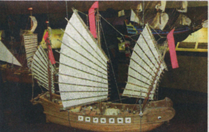
เรือสำเภาจำลอง

ห้องที่ผมชอบมากเป็นพิเศษคือห้องอยุธยาครึบ กลางห้องนี้มีเรือจำลองแขวนแสดงอยู่ ส่วนหนึ่งเป็นกระบวนเรือพยุหยาตรา ที่เหลือก็เป็นเรือแบบอื่นๆ เช่น เรือสำเภาจีน เรือแต่ละลำก็บรรยายละเอียดได้อารมณ์ดีจริงๆ ส่วนติดตั้งห้องโดยรอบมีแง่มุมต่างๆ ที่น่าสนใจมากมาย เช่น อยุธยาเป็นจุดนัดพบของอารยธรรมโลก จีน และญี่ปุ่นก็มี พ่อค้าอินเดีย และเปอร์เซียก็มาฝรั่งก็มาแถมด้วย โดยรวมแล้วกรุงศรีอยุธยานี้มีคนต่างชาติต่างภาษามาปะทะสังสรรค์กันมากถึง 40 ชาชาติทีเดียว