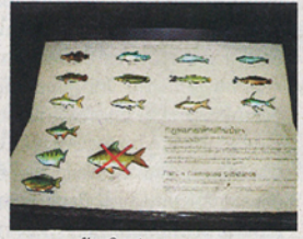
กฎหมายห้ามกินปลา

เสวยปลาเช่นกัน ในรัชกาลสมเด็จพระเจ้าอยู่หัวท้ายสระมีการออกกฎหมายห้ามราษฎรกินปลาตะเพียน เพราะเป็นของโปรดของพระเจ้าแผ่นดิน ผู้ฝ่าฝืนจะถูกปรับเงินถึง 5 ตำลึง” - นี่ก็น่าทึ่งมาก เพราะเหลือจะจินตนาการจริงๆ ส่วนข้อความ