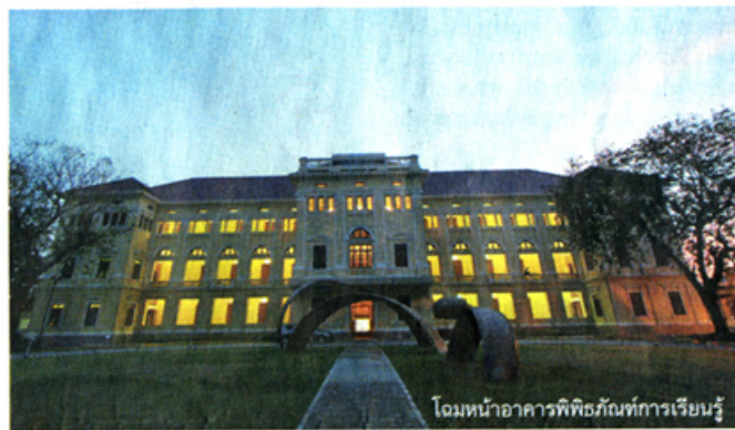
โฉมหน้าอาคารพิพิธภัณฑ์การเรียนรู้

ทางประวัติศาสตร์ชาติพันธุ์ ภูมิปัญญา ฯลฯ อีกทั้งพิพิธภัณฑ์ยังจัดรวบรวมองค์ความรู้อย่างเป็นระบบ ง่ายต่อการสืบค้นและเปิดพื้นที่ให้บริการขยายและต่อยอดความรู้ รวมทั้งจัดกิจกรรมสร้างสรรค์ที่หลากหลาย ตอบสนองความหลากหลายของกลุ่มผู้เข้าชม ลองมาวางแผนที่กันดูว่าเมื่อพิพิธภัณฑ์พร้อมเปิดได้เข้าชมแล้วเราจะได้อะไรกับเรื่องราวได้บ้าง