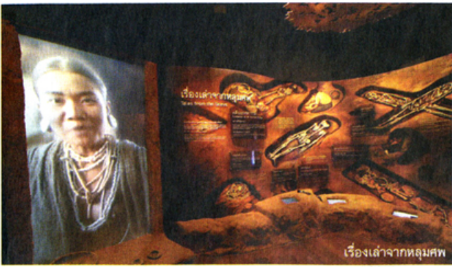
เรื่องเล่าจากหลุมศพ