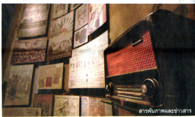
สารพันภาพและข่าวสาร

ส่วนอาคารจัดแสดงนิทรรศการชั่วคราว จะจัดแสดงนิทรรศการหมุนเวียน สามารถปรับเปลี่ยนหัวข้อการจัดแสดงให้ผู้เข้าชมได้ติดตามทันใจสนุกกับการเรียนรู้ประเด็นใหม่ๆ